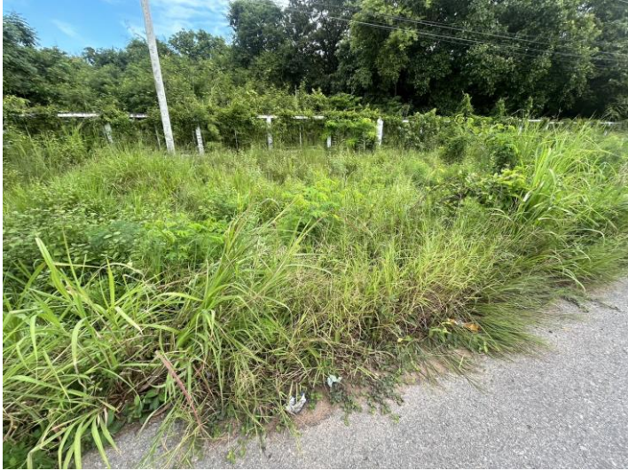
ภาพกิจกรรมก่อนทำ : ตัดแต่งกิ่งไม้, ตัดหญ้า, กำจัดวัชพืช บริเวณหน้า ศูนย์การศึกษาหนองระเวียง